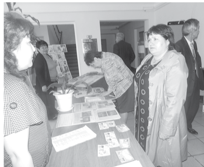
Мероприятие посетило 500 человек

Всем детям хочется иметь маму и папу, многим тяжело приходится в новой семье, адаптация порой проходит долго. В центры помощи детям в основном попадают социальные сироты, их родители лишены своих прав, но дети все равно любят их. Недавно в учреждении появились и дети