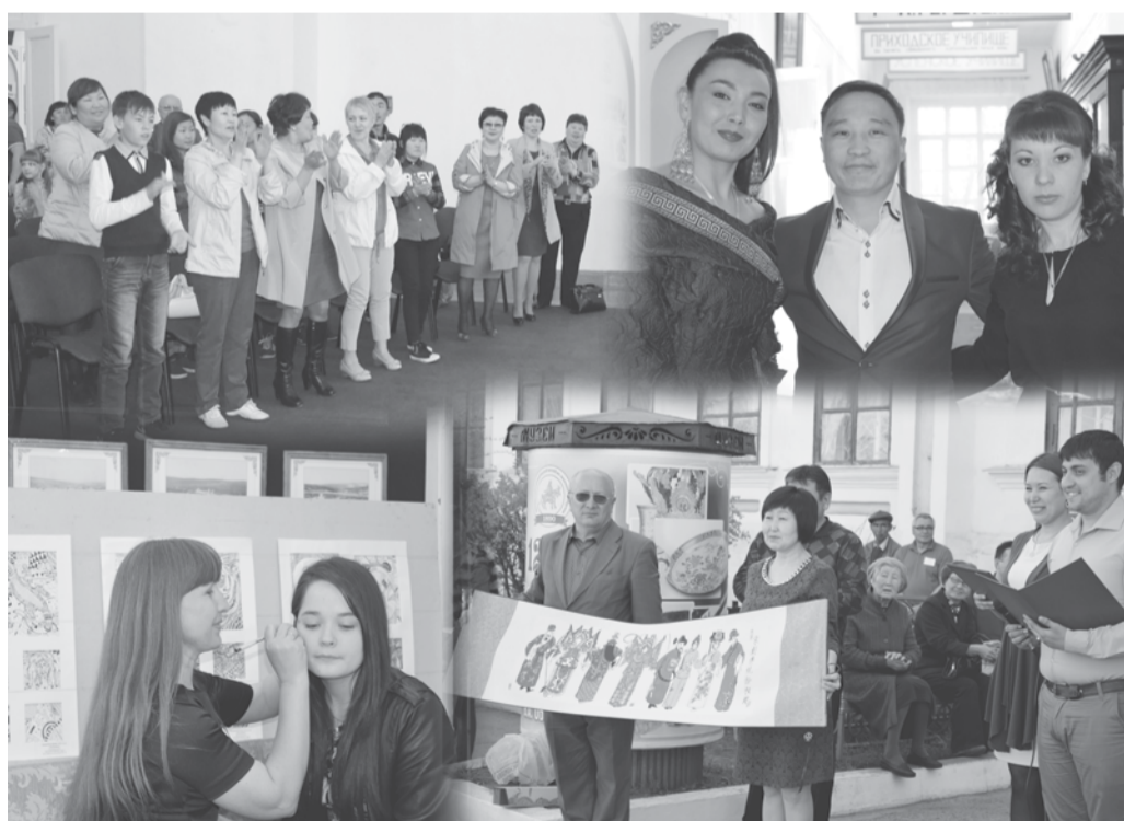
Многообещающая ночь в музее

ЕЖЕГОДНО, В ЧЕСТЬ МЕЖДУНАРОДНОГО ДНЯ МУЗЕЕВ, В НАШЕМ МУЗЕЕ, КАК И ПОВСЮДУ, ПРОХОДИТ АКЦИЯ «НОЧЬ В МУЗЕЕ».