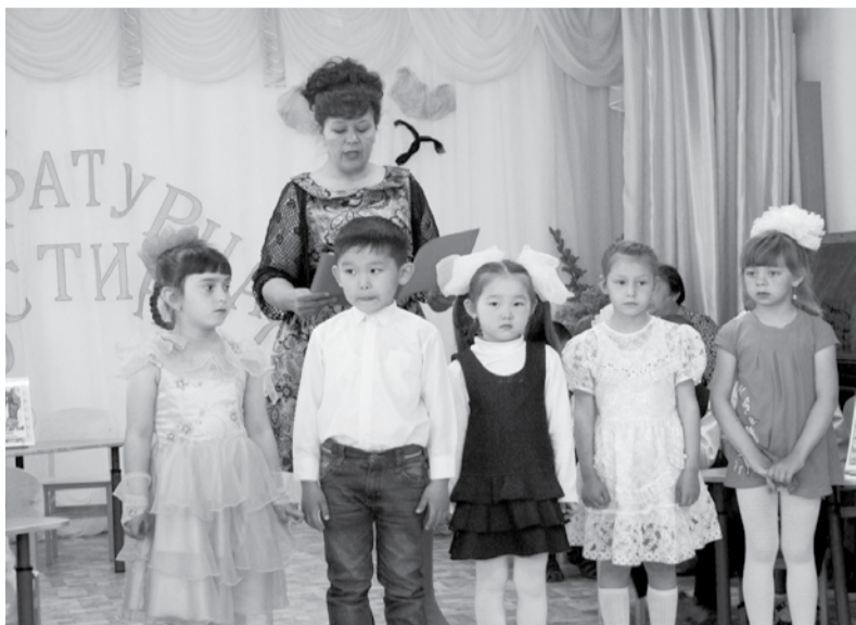
Литературная гостиная в детском саду "Берёзка"

В ОДИН ИЗ МАЙСКИХ ДНЕЙ МНЕ ПОСЧАСТИЛИЛОСЬ ПОБЫВАТЬ НА НЕОБЫЧНОМ МЕРОПРИЯТИИ В ДЕТСКОМ САДУ №6 "БЕРЁЗКА" В П.СЛОБОДА. ПРИ ВХОДЕ В САД ОБРАТИЛА ВНИМАНИЕ НА СТЕНД СОЛИДНОГО ФОРМАТА "НАШИ ДОСТИЖЕНИЯ". АКТИВНОЕ УЧАСТИЕ ДЕТЕЙ И СОТРУДНИКОВ В ЖИЗНИ ГОРОДА, РАЙОНА... ПРИЗОВЫЕ МЕСТА...МОЛОДЦЫ!