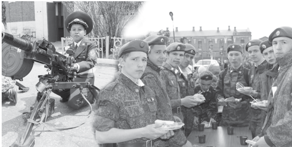
Будущие защитники рубежей

КТО ЖЕ ПРИДЁТ НА ЗАЩИТУ НАШИХ РУБЕЖЕЙ ПОСЛЕ НАС? ВОПРОС КОНЕЧНО РИТОРИЧЕСКИЙ. НО КАК СДЕЛАТЬ ТАК, ЧТОБЫ НАМ НА СМЕНУ ПРИШЛИ ЛЮДИ, ЛЮБЯЩИЕ СВОЮ РОДИНУ, УМЕЮЩИЕ ОБРАЩАТЬСЯ С ОРУЖИЕМ, СПОСОБНЫЕ ЗАЩИЩАТЬ СЕБЯ? ДЛЯ РЕШЕНИЯ ЭТИХ ВОПРОСОВ В ГОСУДАРСТВЕ ПРОВОДИТСЯ КОЛОССАЛЬНЫЙ КОМПЛЕКС МЕРОПРИЯТИЙ, НАПРАВЛЕННЫХ НА ПАТРИОТИЧЕСКОЕ ВОСПИТАНИЕ, В ТОМ ЧИСЛЕ И ДОПРИЗЫВНОЙ МОЛОДЕЖИ – ПОДРАСТАЮЩЕГО ПОКОЛЕНИЯ.