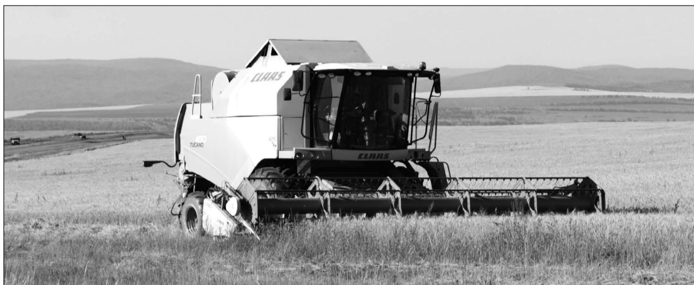
Благодаря господдержке на полях республики сегодня появилась современная отечественная и импортная техника.

Нормативно-правовые документы можно посмотреть в любом правовом навигаторе, а также в сети Интернет на сайте Министерства сельского хозяйства и продовольствия Республики Бурятия ( egov-buryatia.ru/minselhoz/ и www.mtx03.ru ), в разделе «Госпрограммы и республиканские целевые программы».