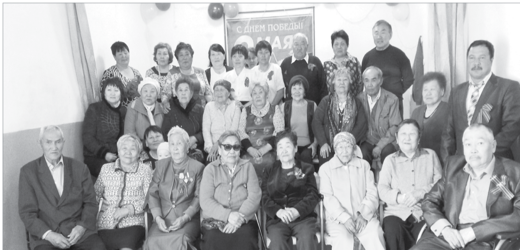
Достоинно встретили 70-ю годовщину Великой Победы в с. Хилгантуй.