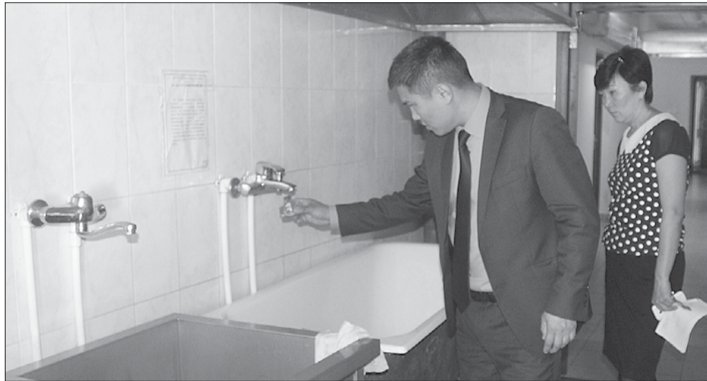
ВЗЯТИЕ ПРОБЫ ВОДЫ В СТОЛОВОЙ КЯХТИНСКОЙ ШКОЛЫ № 2

Другой вопрос в качестве приготовляемых блюд, ведь с этого года комбинат школьного питания перестал существовать. Все школы теперь вновь сами готовят для своих учащихся и,